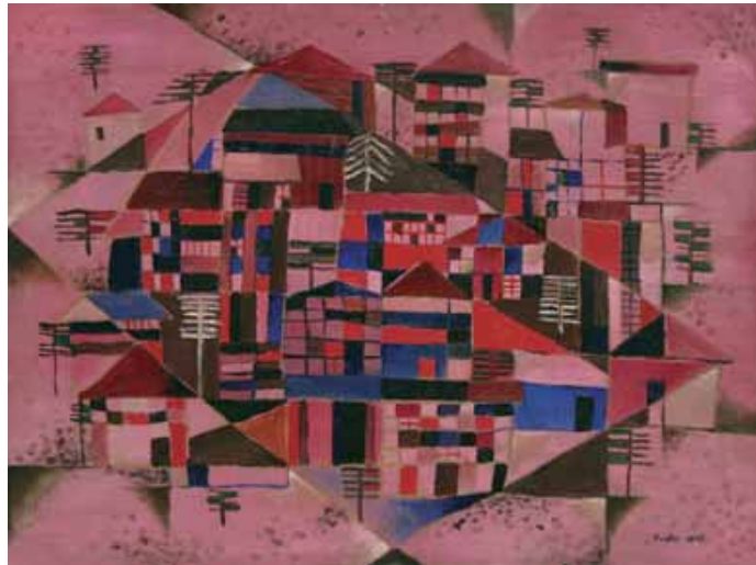
Erich Fuchs (1916–1990) ohne Titel, 1947, Öl auf Hartfaserplatte, 36 x 47,5 cm