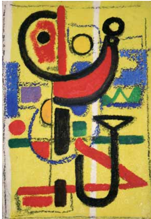
Max Ackermann (1887–1975) Thema auf Gelb, 1943, Öl und Tempera auf Malkarton, 29 x 20 cm