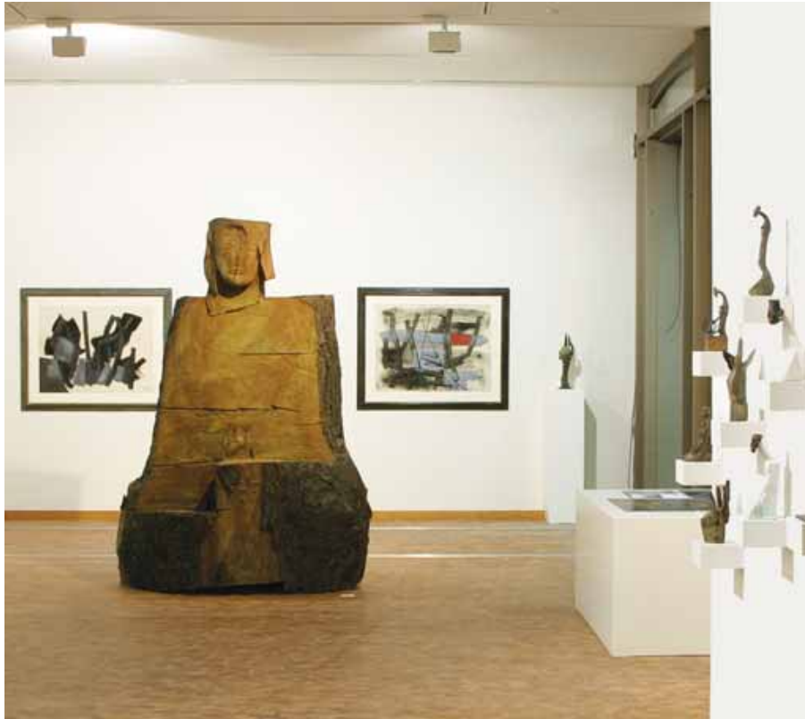
Blick in die Ausstellung mit Dietrich Klinge und Fritz Winter