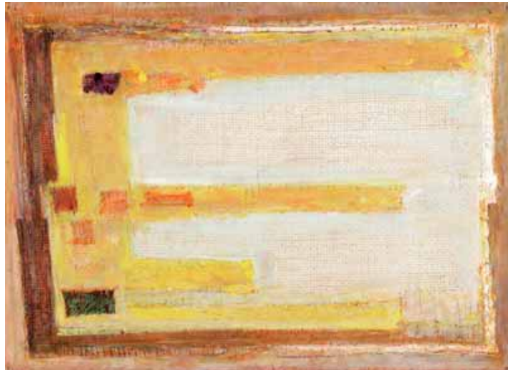
Georg Meistermann (1911–1990) Gelbs, 1989, Öl, Rupfen auf Holz, 39 x 52 cm