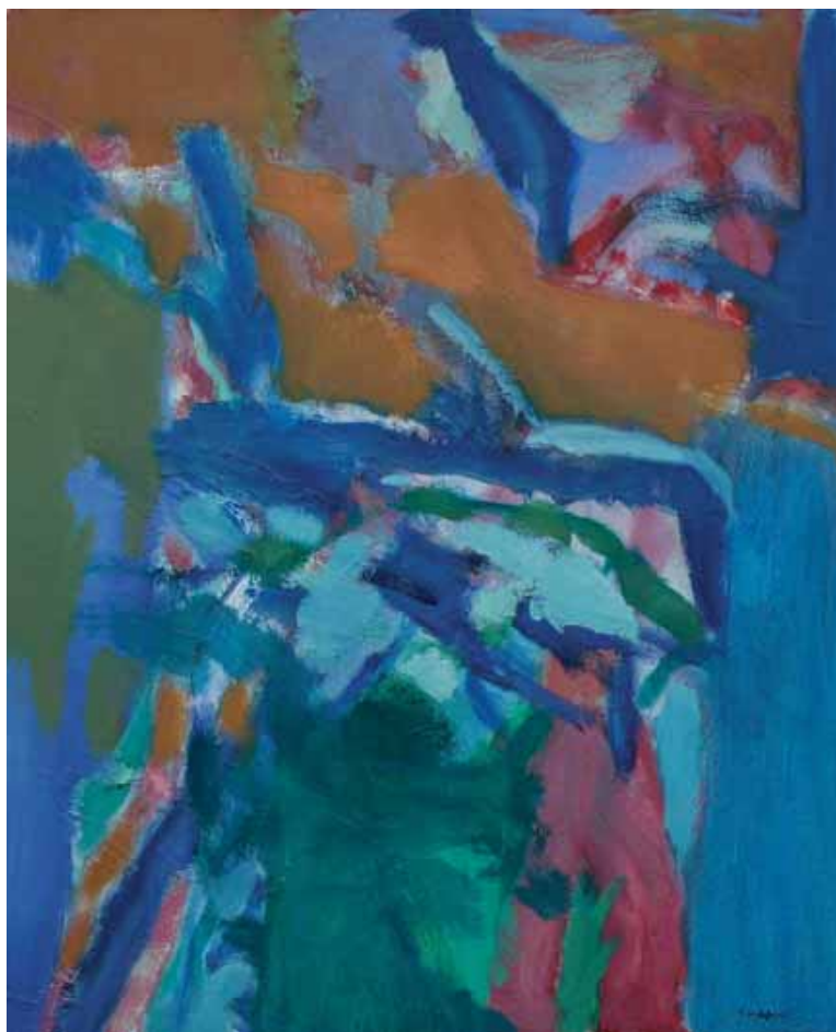
Shmuel Shapiro (1924–1983) Hardsore, 1982, Acryl auf Leinwand, 100 x 80 cm