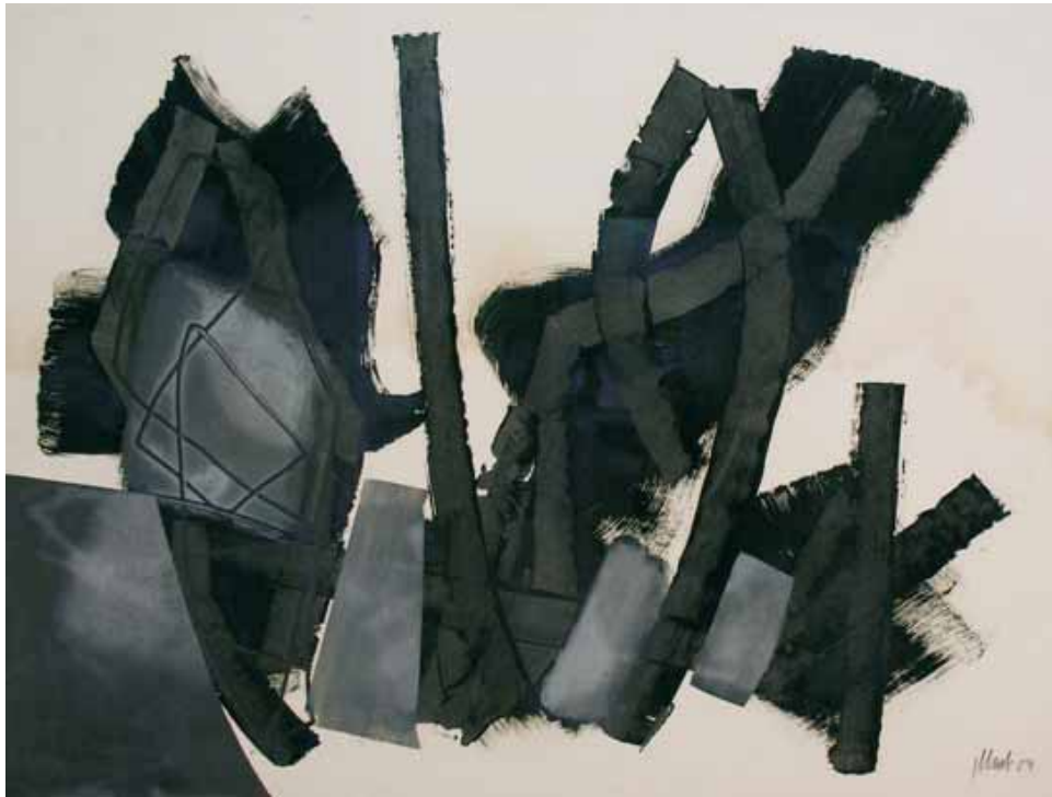
Fritz Winter (1905–1976) ohne Titel, 1954, Öl auf Karton, 74 x 99 cm