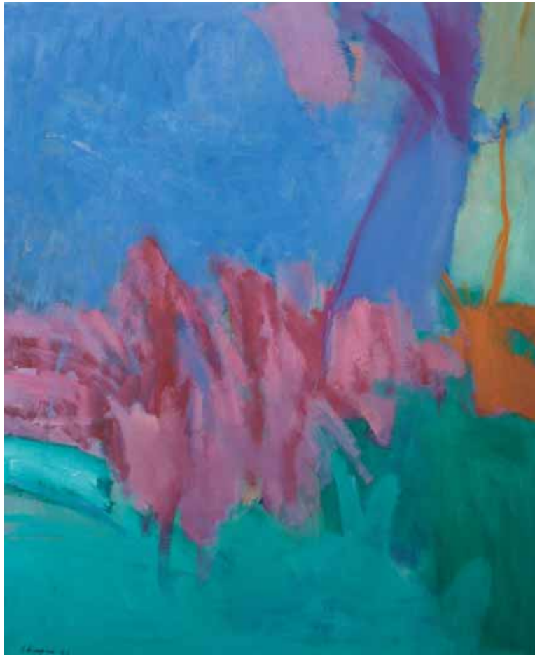
Shmuel Shapiro (1924–1983) Glühen, 1982, Öl auf Leinwand, 100 x 80 cm