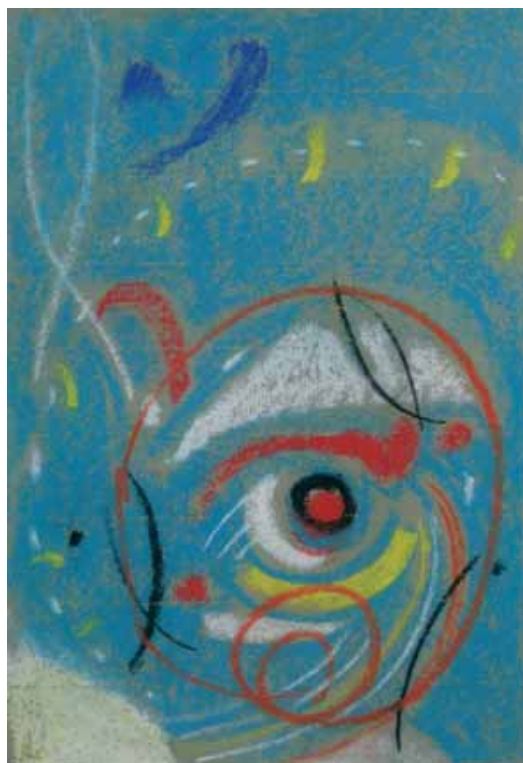
Max Ackermann (1887–1975) ohne Titel, 1958, Pastell auf grauem Büttchen, 23,8 x 16 cm