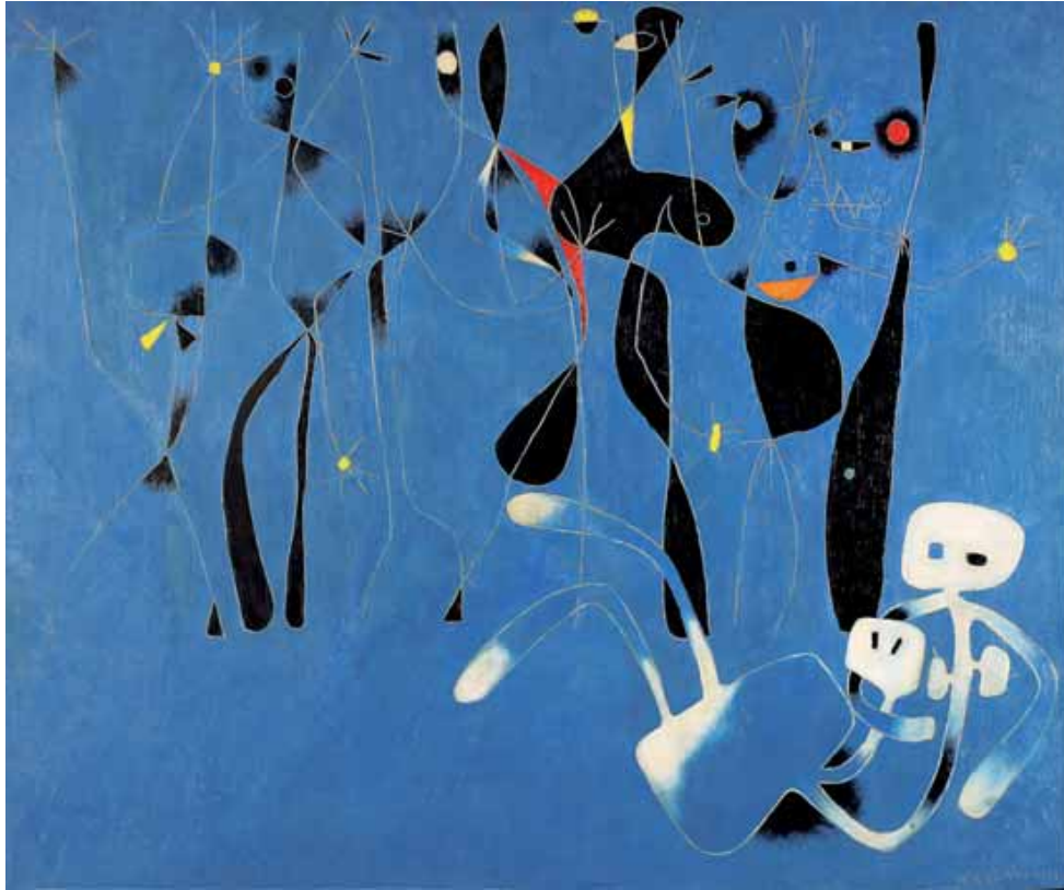
Erich Fuchs (1916–1990) ohne Titel, 1954, Öl auf Hartfaserplatte, 100 x 120 cm