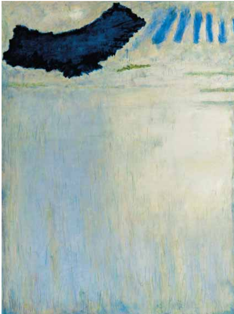
Georg Meistermann (1911–1990) Blauer Bogen, 1989, Öl auf Leinwand, 80 x 60 cm