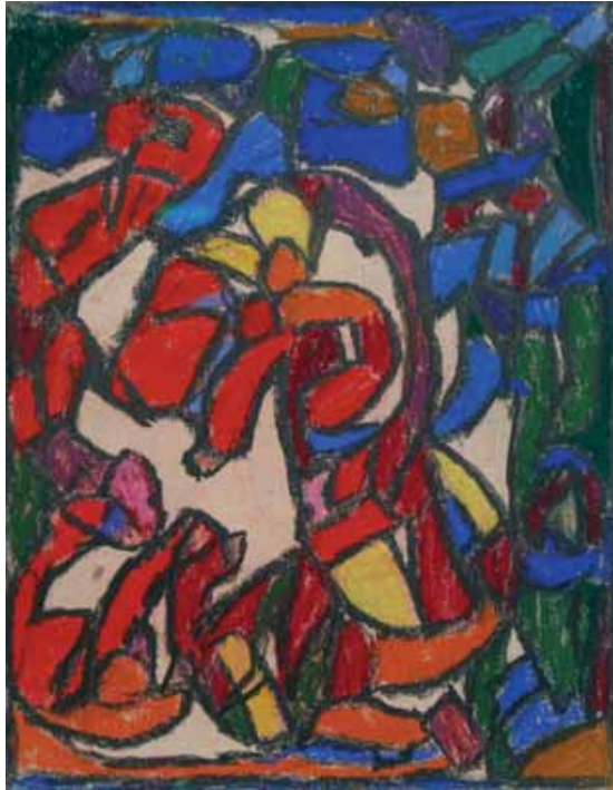
Adolf Hölzel (1853–1934) Komposition 1, ohne Jahr, Pastell auf Papier, 32 x 24,8 cm