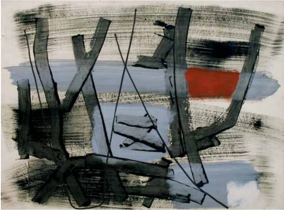
Fritz Winter (1905–1976) ohne Titel, 1954, Öl auf Karton, 74 x 99 cm