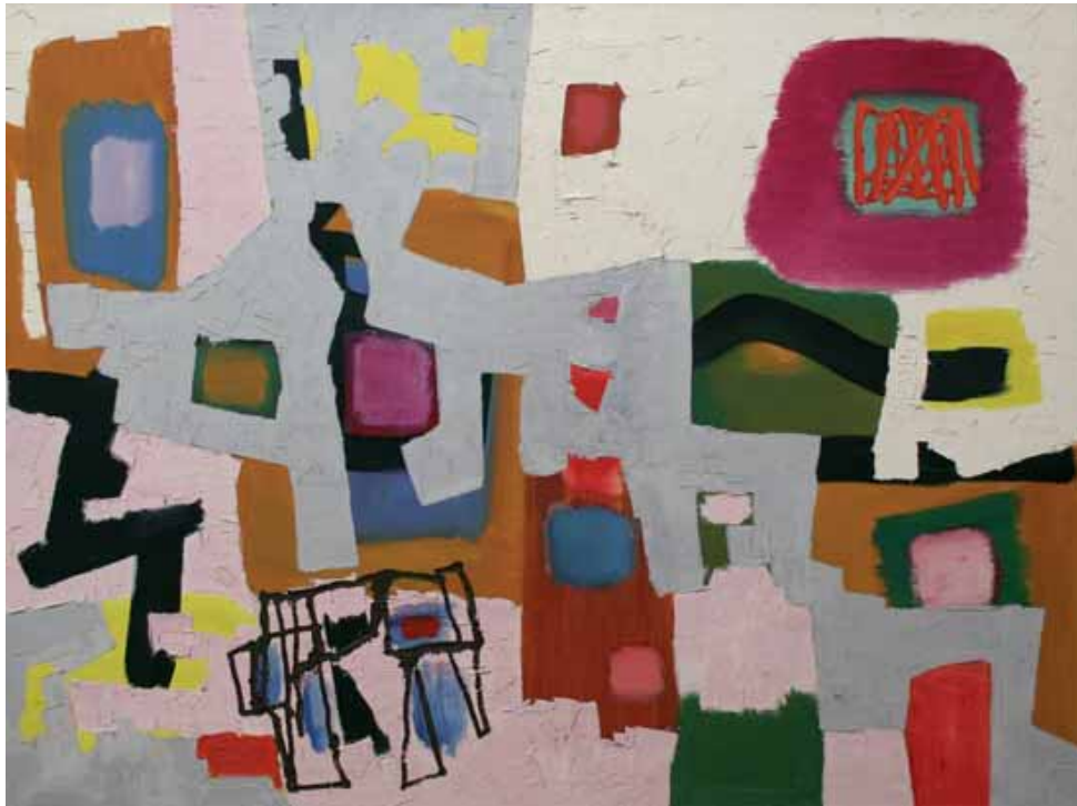
Fritz Winter (1905–1976) Die Wege, 1956, Öl auf Leinwand, 97 x 129 cm