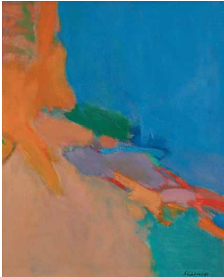
Shmuel Shapiro (1924–1983) ohne Titel, 1981, Öl auf Leinwand, 100 x 80 cm