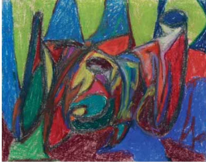
Adolf Hölzel (1853–1934) Komposition figural, ohne Jahr, Pastell auf Papier, 24 x 30,8 cm